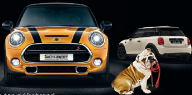
Abbildung zeigt Sondermodell.