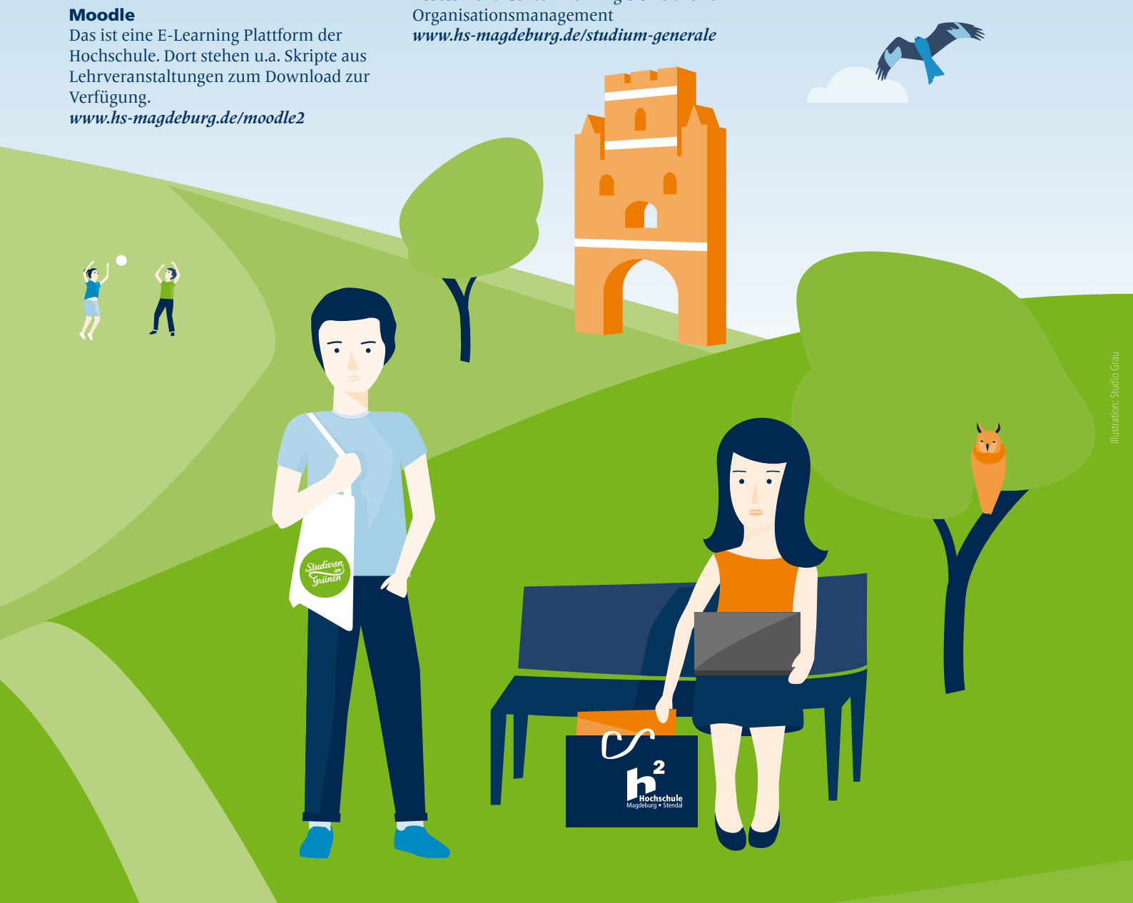
Illustration: Studio Grau